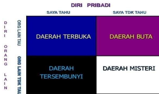
Gambar 2. Model Komunikasi Johari Window

Johari window digunakan untuk meningkatkan persepsi individu pada orang lain. Model ini didasarkan pada pemikiran, yaitu;